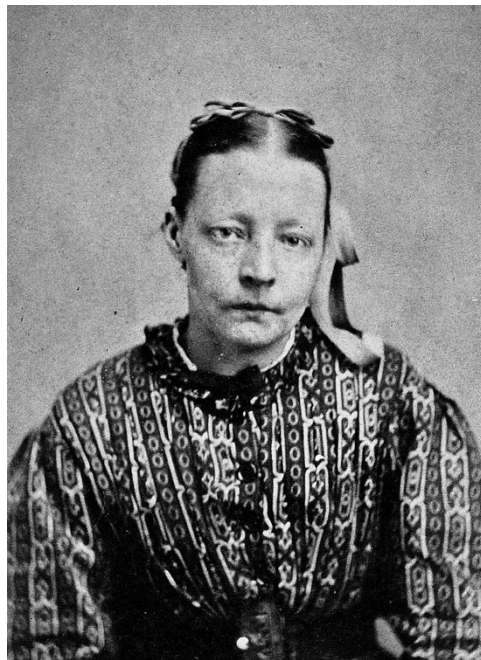
James Crichton-Browne, Uma mulher com os lábios cerrados, West Riding Lunatic Asylum, c. 1869